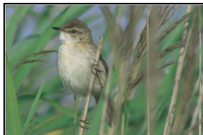
Carricero agrícola Pelicano ceñudo

Ruta y guiage organizados por Neophron Ltd, utilizando guías nativos de Bulgaria. Guías que conocen su país, sus aves y sus costumbres.